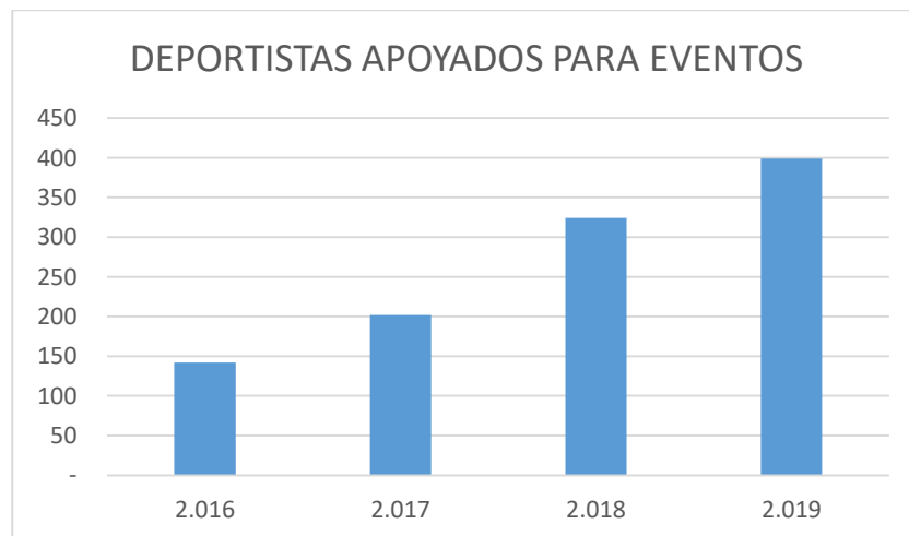
Grafico 02 DEPORTISTAS APOYADOS PARA EVENTOS